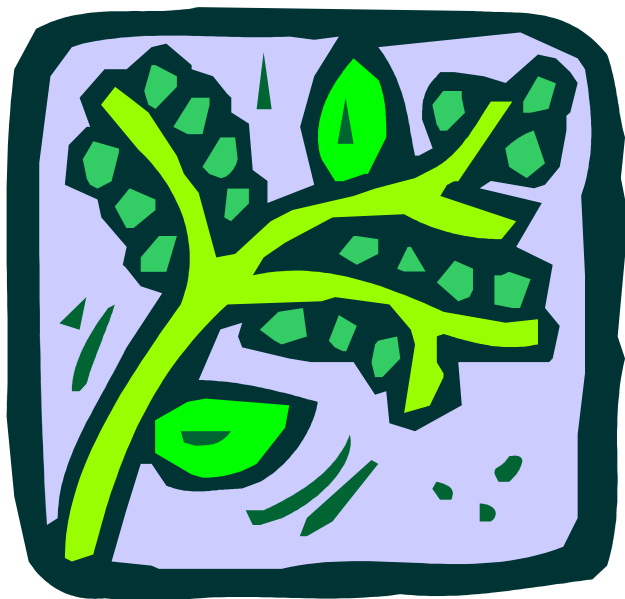
Fotografeer iets uit de natuur